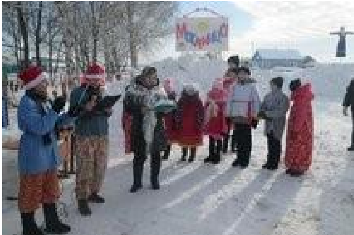
Праздник «Широкая масленица»

Наши предки почитали солнце, как бога. И с наступлением первых весенних деньков, радовались, что солнышко начинает прогревать землю. Поэтому и появилась традиция печь круглые, по форме напоминающие солнце, лепешки. Считалось, что съев такое кушанье, человек получит частичку солнечного света и тепла. Со временем лепешки заменили блинами.